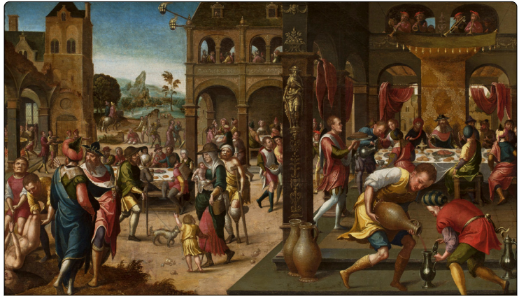
Brunswick Monogrammist - Il-parabbola tal-festa tat-tieg.

tiegħu, qal lid-dixxipli tiegħu, “ Morru! ”, u b’hekk sehibhom fil-missjoni tiegħu stess (ara Lq 10,3; Mk 16,15). Il-Knisja, min-naħa tagħha, b’fedeltà lejn il-missjoni li rċeviet minghand il-Mulej, tibqa’ tmur sa truf l-art, biex terġa’ tohroġ, bla qatt ma tiddejjaq jew taqta’ qalbha quddiem id-diffikultajiet u l-ostakli.